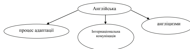
Рис.1. Адаптація англійських неологізмів в українській мові

Запозицієнню з англійської мови сприяє той факт, що за нинішньої доби англійська є глобальною мовою серед інтернаціональної комунікації. Численні англіцизми, що сьогодні вживаються у нашому усному та писемному мовленні проходять певні етапи адаптації, що показано на рис. 1.