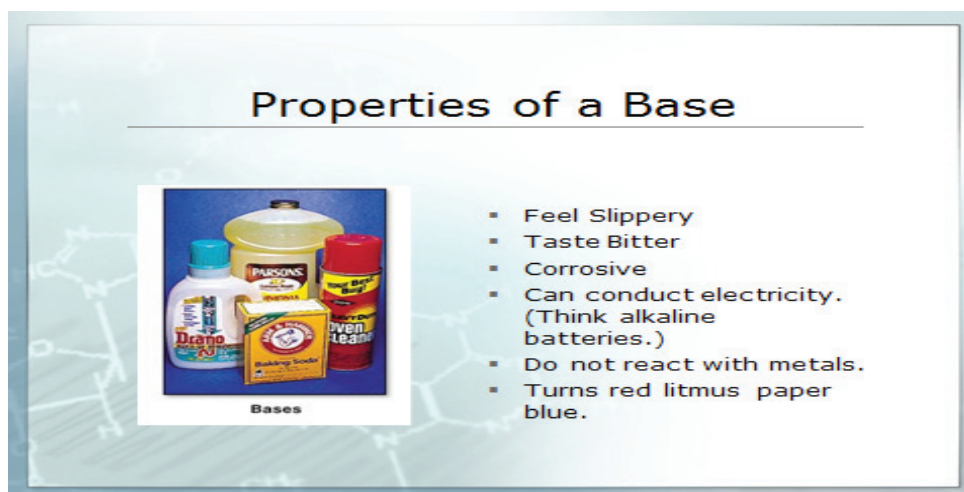
Рис. 3. Властивості основ