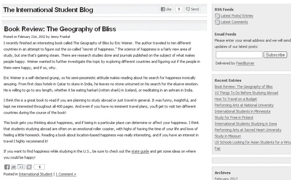
Рис. 2. Блог публічної сфери мовлення [9]

На міжнародному блозі студентів (рис. 2.) можна також вести власний електронний щоденник, розміщуючи події власного життя щодня, практикуючи систематичне використання мови. Даний блог може бути критичним для інших блоггерів, але записи особистого блогу можуть стати публічними, коли забажає їх власник, тим самим особиста сфера мовлення може перейти у публічну.