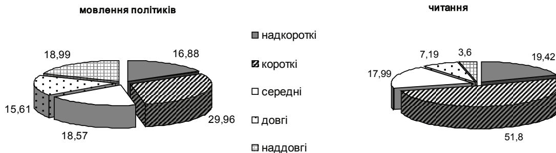
Рис. 2. Розподіл пауз у мовленні політиків і у читанні (у %)

Аналіз промов, виголошених політиками, та тих самих текстів, прочитаних дикторами, показав, що паузальна організація публічного виступу суттєво відрізняє цей вид мовленнєвої діяльності від читання. Відмінності у кількості й тривалості пауз, властивих публічному виступу політиків та читанню текстів промов дикторами, відображено на рисунку 2.